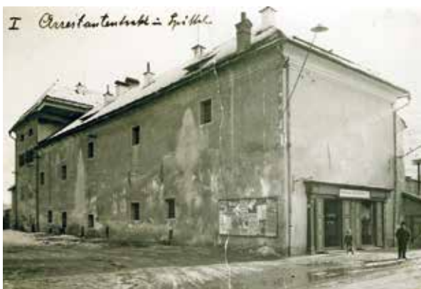
1928: Gefängnistrakt des Landgerichts Ecke Bernhardtgasse/Gmündner Straße