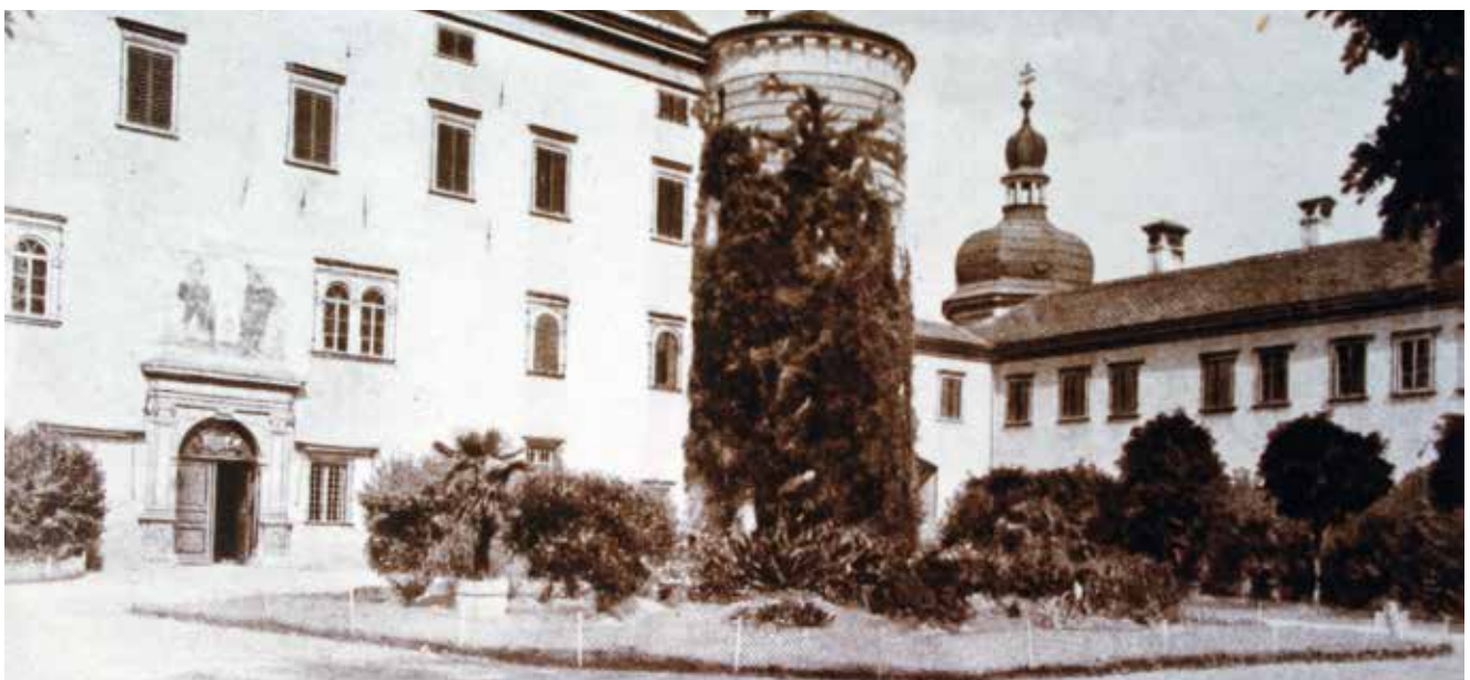
Dicht bewachsen – der Gendarmerieplatz um 1900