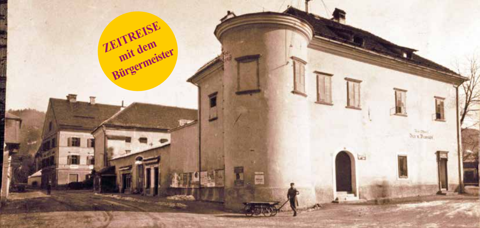
Ca. 1920: Kreuzung Burgplatz/Tiroler Straße/Gmündner Straße: Im Vordergrund das sogenannte Gesindehaus mit Turm