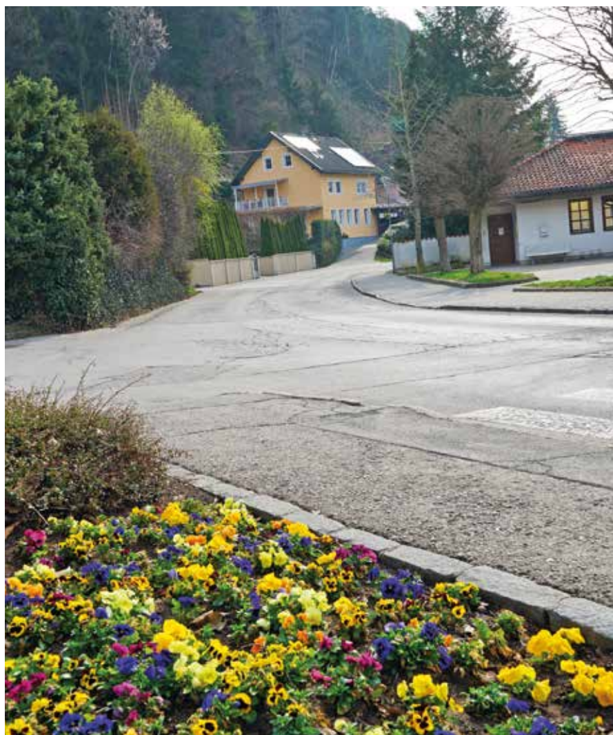
Ab der Kreuzung Mießtaler Straße wird die Edlinger Straße Richtung Osten bis zum städtischen Friedhof saniert

Die Stadtgemeinde Spittal an der Drau bittet alle Anrainer und Verkehrsteilnehmer um Verständnis.