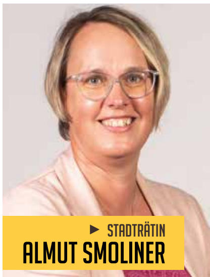
► STADTRÄTIN ALMUT SMOLINER