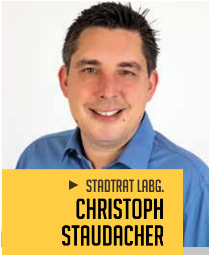
► STADTRAT LABG. CHRISTOPH STAUDACHER

Aus den Referaten Wasserversorgung, Abwasserbeseitigung, Wasserbau, Digitalisierung, Straßenbau, öffentliche Beleuchtung sowie Jugend und Sport