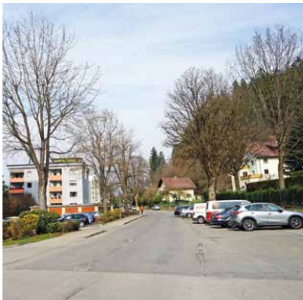
Bis zu diesem Bereich auf Höhe des städtischen Friedhofs wird die Edlinger Straße erneuert

Derzeit wird ein großer Teilabschnitt der Edlinger Straße - von der Einbindung Mießtaler Straße bis zum städtischen Friedhof auf einer Länge von 500 Metern saniert.