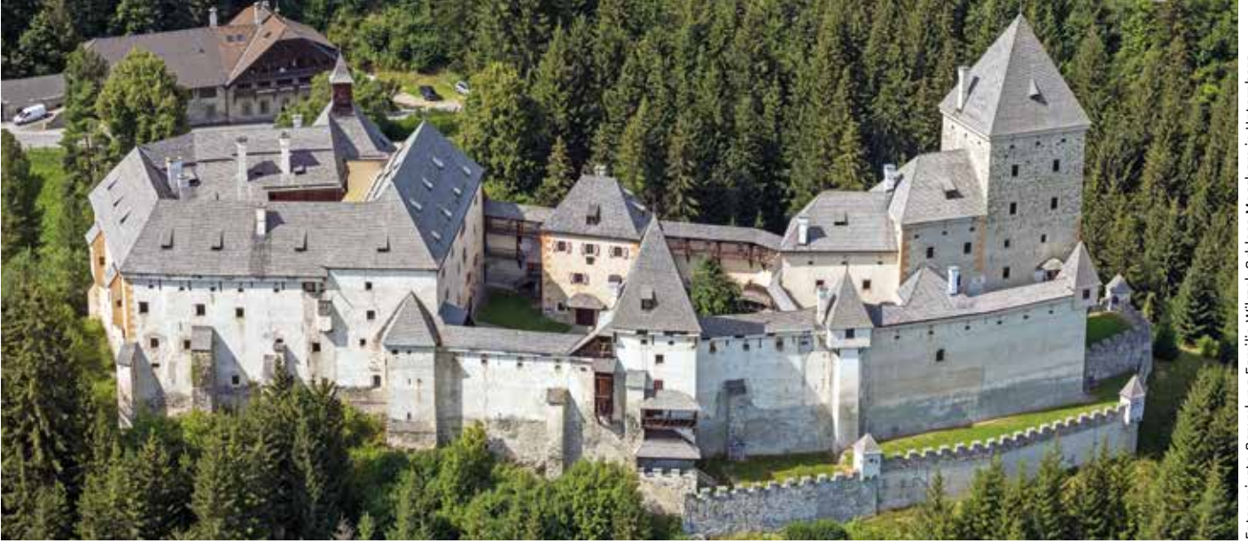
Foto: private Sammlung Familie Wilczek Schloss Moosham in Unternberg