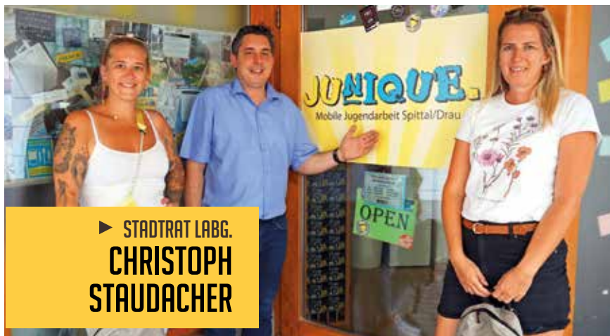
► STADTRAT LABG. CHRISTOPH STAUDACHER

Aus den Referaten Wasserversorgung, Abwasserbeseitigung, Wasserbau, Digitalisierung, Straßenbau, öffentliche Beleuchtung sowie Jugend und Sport