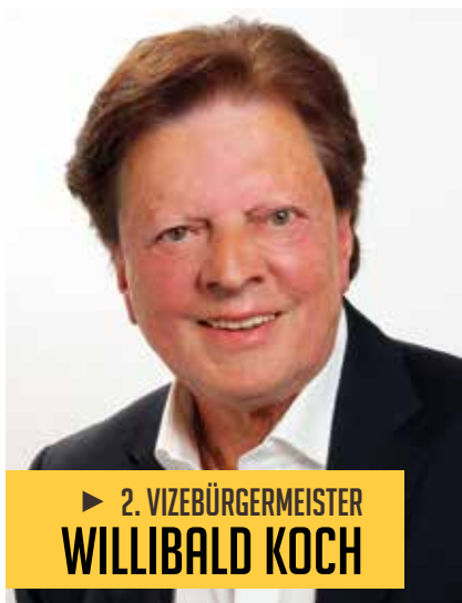
► 2. VIZEBÜRGERMEISTER WILLIBALD KOCH

Aus den Referaten Finanzen, Wirtschaft und Stadtmarketing