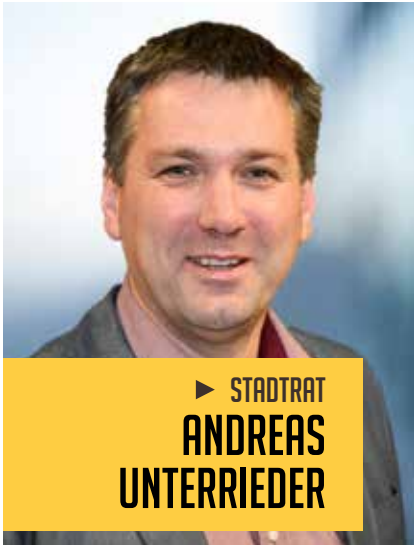
► STADTRAT ANDREAS UNTERRIEDER

Aus den Referaten Kommunale Betriebe, Wohnungen und Europaangelegenheiten