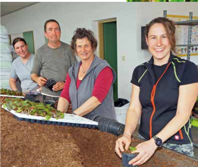
◀ Die Mitarbeiter der Stadtgärtnerei bereiten bereits die Sommerblumen vor, die Mitte Mai gepflanzt und Spittal zum Erblühen bringen werden