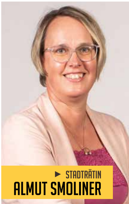
► STADTRÄTIN ALMUT SMOLINER