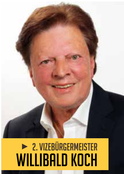
► 2. VIZEBÜRGERMEISTER WILLIBALD KOCH

Aus den Referaten Finanzen, Wirtschaft und Stadtmarketing