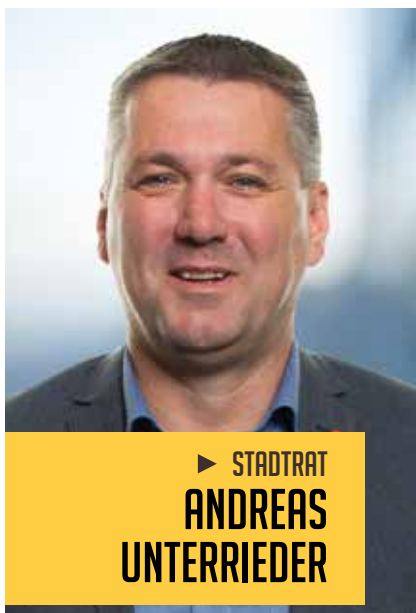
► STADTRAT ANDREAS UNTERRIEDER

Aus den Referaten Kommunale Betriebe, Wohnungen und Europaangelegenheiten