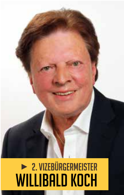
► 2. VIZEBÜRGERMEISTER WILLIBALD KOCH

Aus den Referaten Finanzen, Wirtschaft und Stadtmarketing